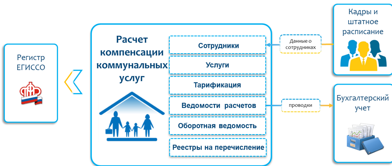
Рисунок 1. Функциональная схема системы «Парус 8. Расчёт компенсации коммунальных услуг».